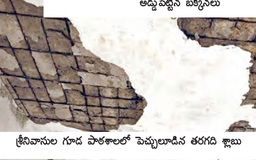
శ్రీనివాసుల గూడ పాఠశాలలో పెచ్చులాడిన తరగది క్లాబ్