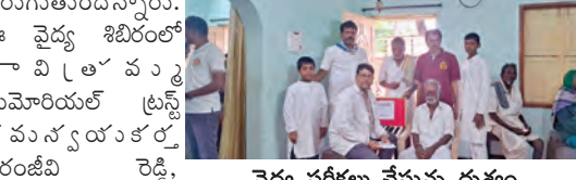
వైద్య పరీక్షలు చేస్తున్న దృశ్యం