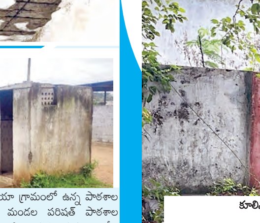
కూలిన జడపిహెచ్ పాఠశాల ప్రహారీ గోడ

పెద్దమఠ, జూలై 27, ప్రభాతవార్త: జడపిహెచ్ పాఠశాలలో కనీస మౌళిక వసతులు లేకపోవడంతో ఉపాధ్యాయులు, విద్యార్థులు అవస్థలు పడుతున్నారు. ప్రభుత్వ పాఠశాలలో నకల సౌకర్యాలు ఉండాలన్న లక్ష్యంతో ప్రభుత్వం లక్షల రూపాయలు వెచ్చిస్తున్న సంబంధిత అధికారుల, కాంట్రాక్టర్ల నిర్లక్ష్యంతో నీరుగారిపోతున్నాయి. అందుకు ఉదాహరణగా పెద్దమఠ మండలం మంజుపూర్ జిల్లా పరిషత్ ఉన్న పాఠశాల, 6 నుంచి 10వ తరగతి వరకు కొనసాగుతున్న ఈ పాఠశాలలో 375 విద్యార్థులకు 18 మంది ఉపాధ్యాయులు విద్యాభ్యాసం చేస్తున్నారు. తాండూరు - హైదరాబాద్ ప్రధాన మార్గములో ఉన్న ఈ జడపిహెచ్ పాఠశాలలో సమస్యలు తాండవం చేస్తున్నాయి. పశువుల దొడ్డిగా మారిన ప్రాంతం ప్రధానంగా విద్యార్థులకు తాగునీరు కోసం మిషన్ భగిరథ నీరు సక్రమంగా రావడంలేదని ఉపాధ్యాయులు, విద్యార్థులు పేర్కొంటున్నారు. తాగునీటి కోసం బోరు మోతారు ఉన్న అట్టి నీళ్లు మంచిగా ఉండటంలేదని వాపోతున్నారు. పాఠశాల ప్రహారీ గోడ కూలిపోవడంతో కుక్కలు, పందులు, పశువులు స్వైరమీచడం చేస్తున్నాయి. అంతేకాకుండా రాత్రి వేళలో దూసుపోతూ, మధ్యలకు ప్రయింపులు నిలయంగా మారినదని పలువురు ఆరోపిస్తున్నారు. వర్షపు నీరు కూడా పాఠశాల ఆవరణలో నిలవడంతో దోచుకు, ఈగలు రోతబట్టిస్తున్నాయని ఆందోహాసం వ్యక్తం చేస్తున్నారు. నిధులు మంజూరై నిర్లక్ష్యమేనా? సుమారు ఏడాదిన్నర క్రితం టాయిలెట్లు నిర్మాణం కోసం రూ. 7.65 లక్షలు మంజూరు చేశారు. అందులో మొదల విడతగా రూ. 2.80 లక్షల వరకు బిల్లులు డ్రా చేసుకున్నారు. సగం వరకు