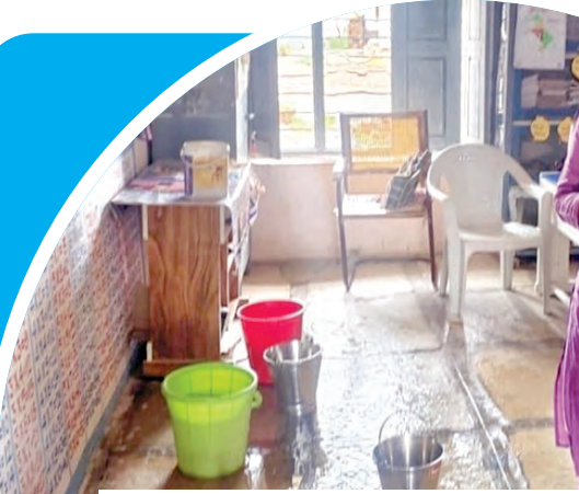
వర్షం కురుస్తుండటంతో నీరు కింద పడకుండా ఆహ్లాపిస్తున్న బజ్జీసలు