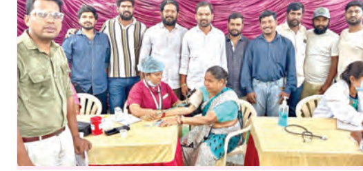
వైద్య పరీక్షలు చేస్తున్న దృశ్యం