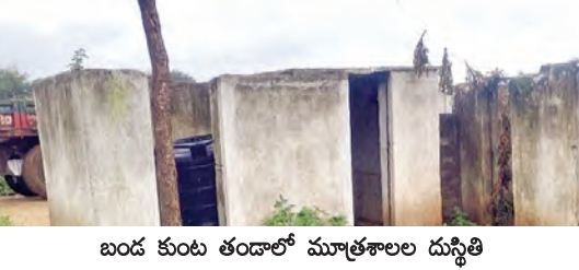
బండ కుటుంబం తండ్రి మూత్రశాల దుస్థితి